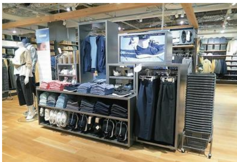
1フロアの広い売り場を生かし、衣服売り場を拡充した

店頭で物作りも——良品計画が新しい店舗を作った。16日、東京の錦糸町パルコにオープンした無印良品だ。1フロアで売り場面積2800平方メートルは関東では最大級。スペースを生かし、ほぼフルラインの商品を揃え、見せ方にも工夫を凝らした。モノを買うだけでなく、客が店で過ごす時間を楽しめるよう、カフェや子供が遊ぶ空間を設け、好みのデザインやサイズの靴下がオーダーできる編み機も設置した。(柏木均之)